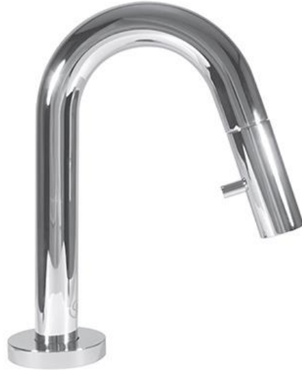
Ideal Standard Koudwaterkraan 6 l/min met hoge uitloop en geïntegreerde bediening in chrom