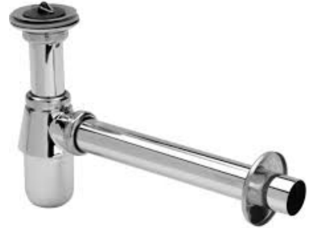
Viega Plugbekersifon met muurbuis en rozet, chrom