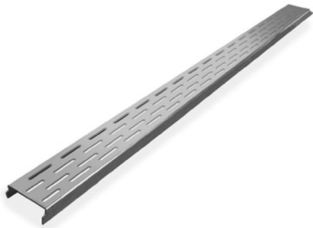
Showerdrain met RVS rooster 68,7 cm