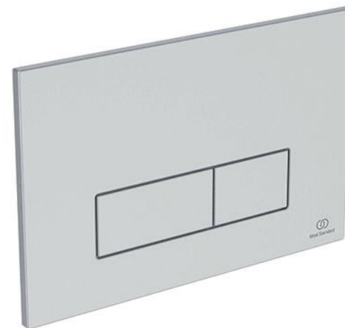
Ideal Standard Bedieningspaneel Oleas M2 mat chroom