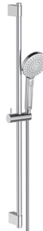
Ideal Standard Glijstangcombinatie 90 cm met handdouche met 3 functies 8 l/min en Idealflex 175 cm doucheslang chrom

De badkamer wordt voorzien van een elektrische handdoekradiator dnl E-Comfort Claudia EcoDesign 40 x 119,5 cm, 600 Watt, in RAL9016 met digitale thermostaat