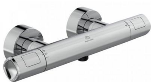
Ideal Standard Douchethermostaat cool body chrom