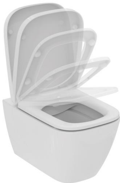
Ideal Standard Wandcloset i.life rimless met softclose zitting en deksel, kleur wit