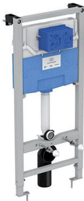
Ideal Standard Inbouwreservoir